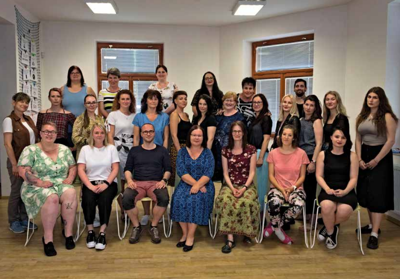
Zaměstnanci střediska, rok 2023